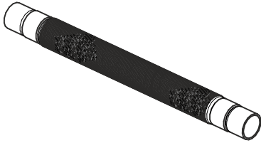
Рис.1. Общий вид

Виброгасители предназначены для установки в стационарных и передвижных системах охлаждения. Основной функцией виброгасителя является устранения передачи вибраций от работающего компрессора на нагнетающую, всасывающую магистраль и элементы холодильной системы. Виброгаситель может компенсировать незначительные «тепловые» изменения линейных размеров труб.