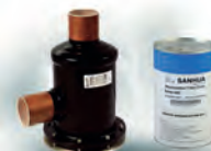
Фильтр-осушитель со сменным сердечником