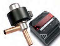
Электронный расширительный вентиль

2 ИЗ 3-Х КОНДИЦИОНЕРОВ ОСНАЩЕНЫ 4-Х ХОДОВЫМИ ВЕНТИЛЯМИ SANHUA