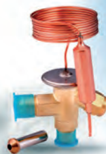
Термостатический расширительный вентиль