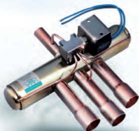
4-х ходовой реверсивный вентиль